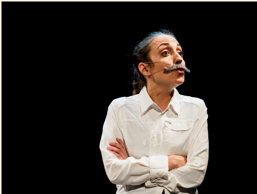
Hépatik Girl

On assiste en effet à cette explosion des maladies auto-immunes de toutes sortes, souvent groupées d'ailleurs dans un même individu. Pour vous donc est-ce lié à leur plus grande visibilité ou est-ce dû à des dérèglements environnementaux croissants ? Je ne suis pas médecin. Je ne rapporte donc que ce que je lis et ce que plusieurs médecins et scientifiques m'ont expliqué. On constate une augmentation de la prévalence des maladies auto-immunes, inflammatoires, chroniques, ainsi que de certains cancers, et ce n'est pas dû uniquement au fait qu'on les diagnostiquerait plus tôt. En effet, la dégradation du vivant, la perte de la biodiversité, la pollution... sont autant de facteurs qui contribuent à appauvrir nos microbiotes intestinaux, et ainsi à fragiliser système immunitaire. J'ajoute cependant les facteurs sont aussi multiples : la génétique, le stress, les infections bactériennes... tout cela peut contribuer à permettre le déclenchement de ce type de maladies.