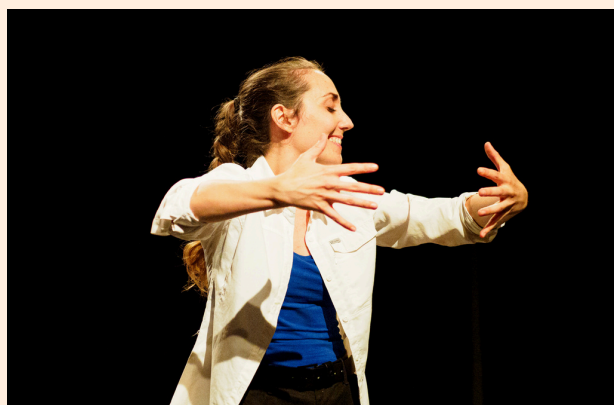
Hépatik Girl © Marie Charbonnier

Oui, en tant qu'aidant, en tant que proche... Et plus largement, on a tous un corps, on vit tous sur cette Terre, on partage l'air qu'on respire, on mange ces aliments qui viennent des sols que l'on cultive... Le spectacle nous invite à nous y relier. Par ailleurs, dans quasiment chaque scène du spectacle, je crois qu'il est possible de se retrouver, que l'on soit, ou non, concerné par un problème de santé. Il y a beaucoup de personnages : des agents immobiliers, une banquière, une esthéticienne, une institutrice, un grand-père, etc.